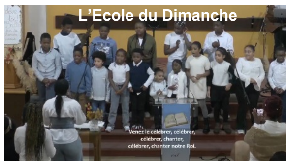
L'Ecole du Dimanche

Le thème du culte par les jeunes, « Que personne ne méprise ta jeunesse » est un conseil de l'apôtre Paul à Timothée. Proclamé ainsi par notre jeunesse, nous entendons à la fois un conseil aux jeunes et l'expression d'un vœu de la jeunesse de l'église qui invite l'église à la considérer en tant qu'une grâce de Dieu pour l'église de maintenant car « aux âmes bien nées, la valeur n'attend point le nombre des années » le disait Corneille. Il revient donc aux responsables de l'église d'entourer cette jeunesse (et donc pas de l'étouffer !) pour discerner et reconnaître en son sein les dons et pouvoir leur donner l'occasion de s'exprimer au sein de l'église.